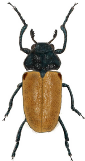
Figure 1 : Labidostomis longimana (Dessin de J-L Charpentier)

Labidostomis longimana est un petit coléoptère appartenant à la famille des Chrysomelidae et à la sous famille des Clytrinae. Il se rencontre des zones steppiques de l'Asie, au sud de l'Europe. En France l'espèce semble présente sur la plupart du territoire, à l'exception des régions les plus nordiques.