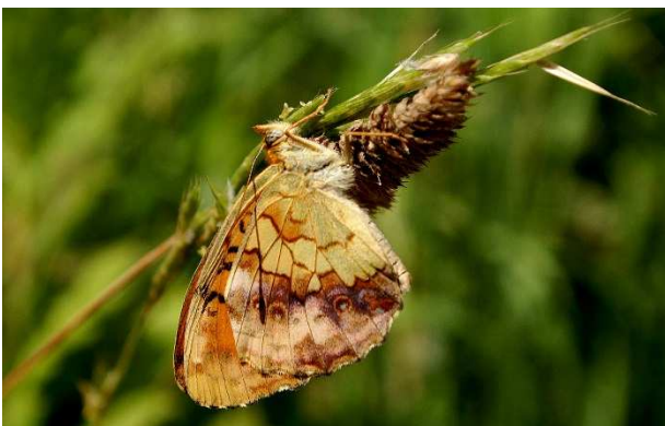
Figure 1 : Brenthis daphne

Dans la partie nord-ouest de la France, ce papillon a été observé plus ou moins ponctuellement dans quelques régions.