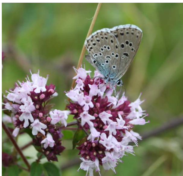
Figure 1: Maculinea arion

Maculinea arion (Linné, 1758) ou l'Azuré du Serpolet est un lépidoptère rhopalocère de la famille des Lycaenidae protégé en France (Arrêté du 23 avril 2007, Article 2) et en Europe (Annexe IV de la Directive Habitats-Faune-Flore). Comme les autres espèces du genre Maculinea il bénéficie d'un plan national d'action [DUPONT, 2011].