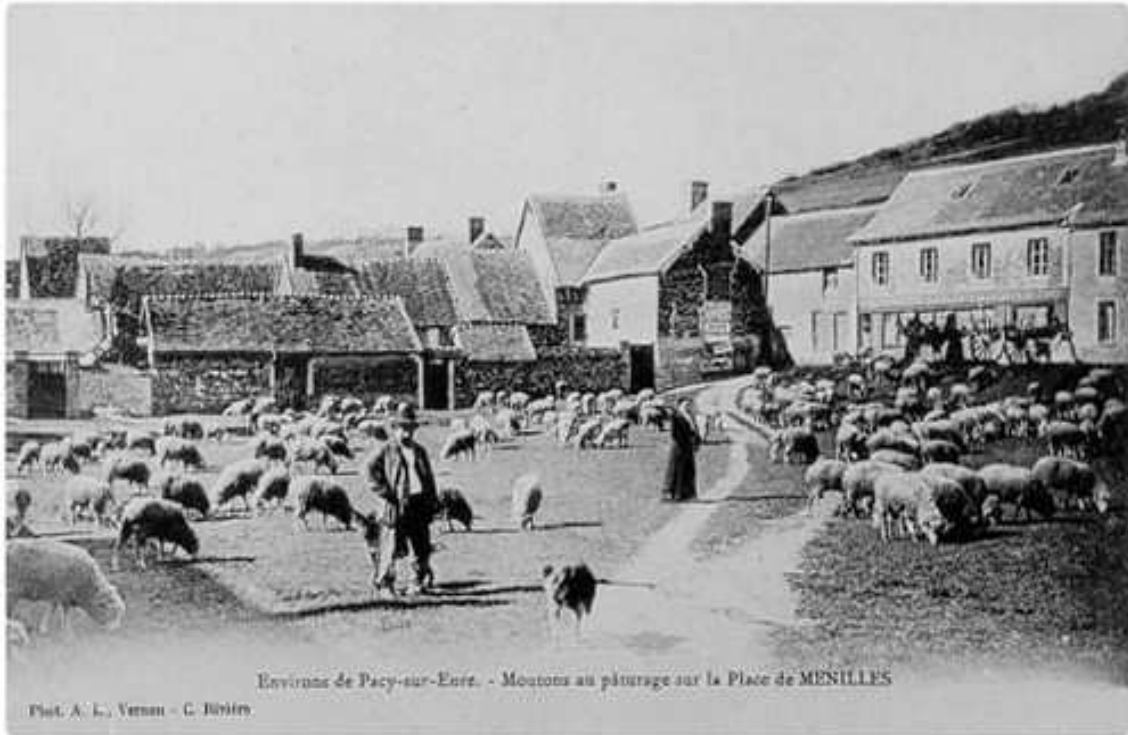
Figure 4 : Paturage ovin sur la place de Ménilles