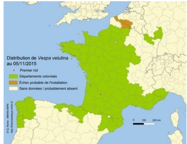
Carte 2 : distribution de Vespa velutina au 05/11/2015

Le Frelon asiatique, Vespa velutina , est un frelon d'origine asiatique dont la présence en France a été signalée pour la première fois dans le Lot-et-Garonne. Les populations actuelles sont issues de femelles fondatrices qui auraient pu être introduites avec des poteries importées de Chine par un horticulteur. Ce dernier a en effet remarqué sa présence autour de sa propriété dès 2004. L'insecte s'est depuis largement répandu dans une grande partie de l'ouest de la France pour atteindre la Normandie en 2011 (LIVORY, 2011).