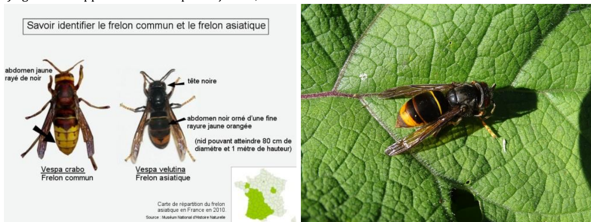
Figure 1 : savoir identifier le frelon commun et le Frelon asiatique

Le Frelon d'Europe ( Vespa crabro Linnaeus, 1758) est plus grand et se distingue par son corps taché de roux, de noir et de jaune. Son abdomen est jaune, rayé de noir.