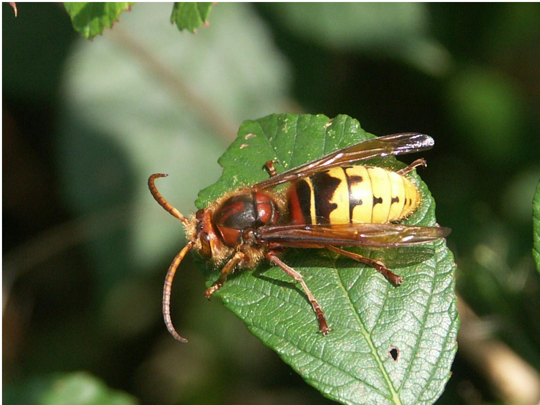
Figure 9 : Vespa crabro , Frelon européen