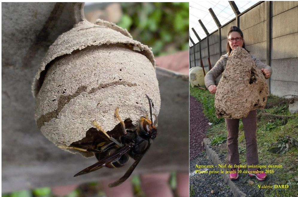
Figure 3 : nid primaire et nid secondaire