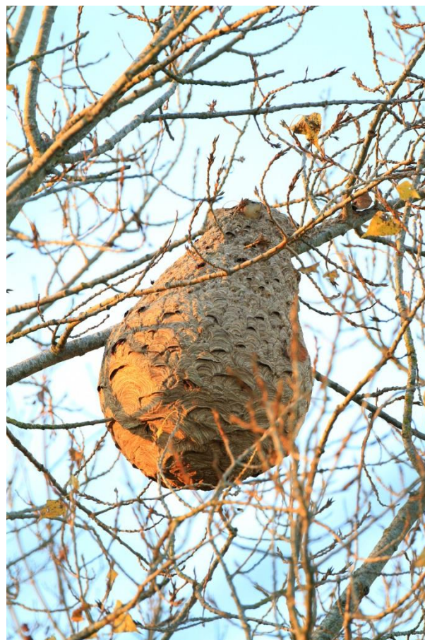
Figure 7 : nid de Frelon asiatique à SAINT-PIERRE-LA-GARENNE

nidifier si elles sont fécondées. Cependant, un grand nombre de ces reines ne passeront pas l'hiver, mais beaucoup survivront, environ 100 à 150, pour refonder dès le printemps une nouvelle colonie, ce qui met en évidence la forte expansion du Frelon asiatique.