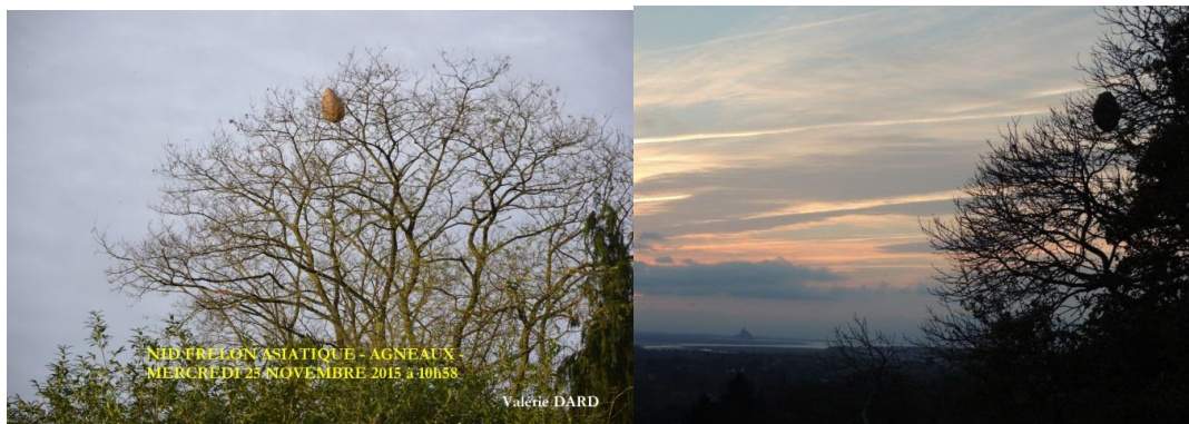
Figure 5 : nid de Frelon asiatique à Agneaux

En été, l'activité de la colonie s'intensifie considérablement et la taille du nid augmente pour atteindre son maximum. C'est alors que, comme pour d'autres frelons, la colonie se délocalise vers un autre nid construit à un emplacement plus dégagé et plus élevé lorsque le site primaire devient trop étroit ou l'environnement défavorable. Une partie des ouvrières construit alors un nouveau nid dit secondaire, généralement à la cime des arbres, dans lequel tous les adultes, reine comprise, s'installent. Des ouvrières restent dans le nid primaire pour s'occuper du couvain jusqu'à ce que les dernières nymphes aient éclos. Le nid secondaire de forme ovoïde est de grande taille puisqu'il peut atteindre 80 cm de diamètre pour 1,50 m de hauteur.