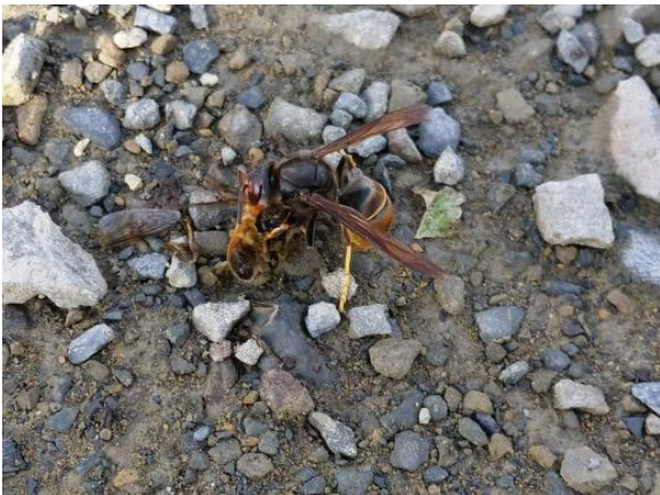
Figure 8 : Frelon asiatique dévorant une abeille

Le Frelon asiatique se positionne en vol stationnaire à l'entrée d'une ruche, attendant qu'une abeille butineuse revienne chargée de pollen ; il saisit l'abeille au passage et après lui avoir coupé la tête et arraché les pattes et les ailes, façonne une boulette avec le thorax qui est le seul qui comporte des protéines nécessaires à l'alimentation des larves.